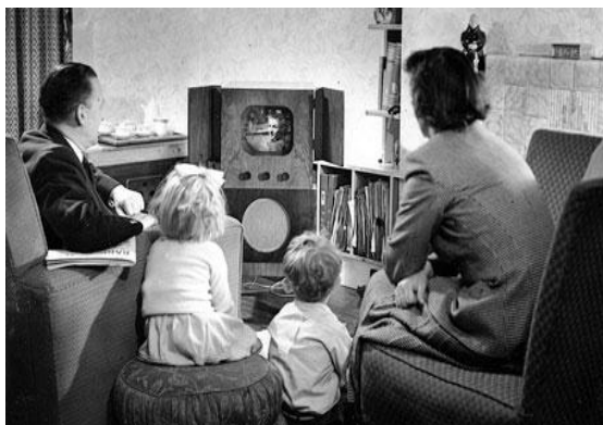
Figura 1: Em 1950, a televisão se tornou uma das formas de interação social preferidas pelas famílias 11

Historicamente a televisão foi concebida como uma espécie de "janela para o mundo" ou "laço social", capaz de reunir famílias e a nações em torno dos "vislumbres de um mundo fora da nossa experiência diária" (LOTZ, 2007, p.03). Sendo um produto da e para a sociedade, a televisão, em mais de sete décadas de existência, passou por diversas reconfigurações. Em uma relação dialética, influenciou e também foi influenciada por mudanças na sociedade.