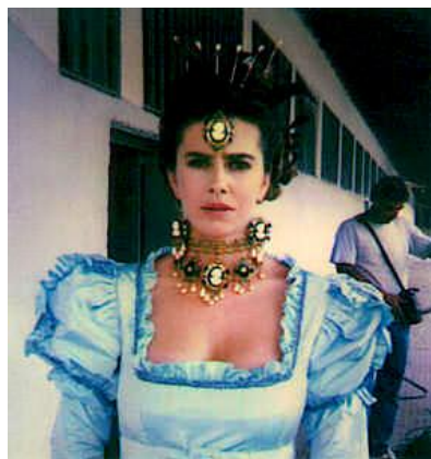
Figura 3. Maitê Proença como Dona Beija, em novela homônima de 1986 22

Em 1986, a extinta Rede Manchete lança a telenovela “Dona Beija”. Sua protagonista, que dá nome à trama, é a cortesã interpretada por Maitê Proença, a proprietária do refinado bordel Chácara do Jatobá. A história se passa no século XIX, na cidade de São Domingos do Araxá (MG), onde Dona Beija desperta a indignação das famílias conservadoras da cidade. Dona Beija era também uma meretriz de luxo.