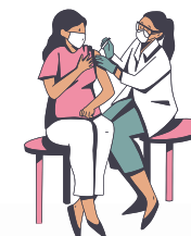
Vacinar quando for disponibilizado vacina para o seu público-alvo

Como algumas pessoas infectadas podem não estar ainda apresentando sintomas ou os sintomas podem ser leves, manter uma distância física de todos é uma excelente medida de proteção.