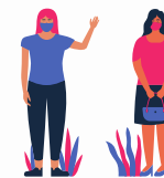
Usar máscara e manter distância de 1 m de outras pessoas

Praticar a higiene das mãos e respiratória é importante em TODOS os momentos e é a melhor maneira de proteger aos outros e a si mesma(o). Sempre que possível, mantenha uma distância de pelo menos 1 metro entre você e os outros, principalmente se você estiver ao lado de alguém que tosse ou espirra.