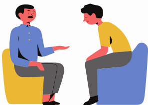
Gotículas de salivas