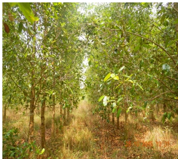
Figura 1 - Plantio comercial de Calophyllum brasiliense Cambess.

O estudo foi realizado em um plantio comercial da espécie Calophyllum brasiliense Cambess (Guanandi) aos com 7 anos de idade, de propriedade da empresa JAMP Agropecuária e Reflorestadora Ltda. (Figura 1), situada no município de Dueré, região sul do estado do Tocantins.